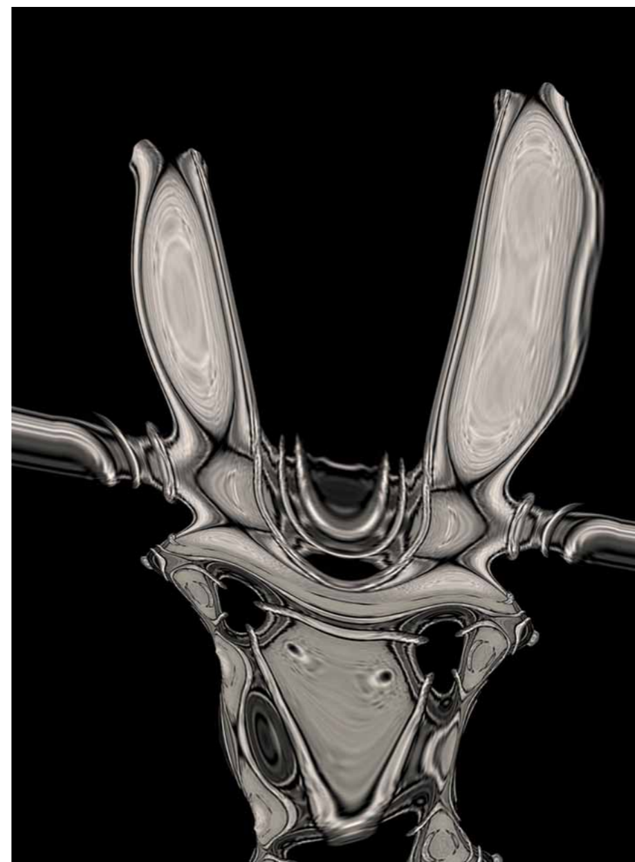
antónio canau "Winged Mechanical Figure", 2013 impressão digital/digital print 40,1 x 30cm