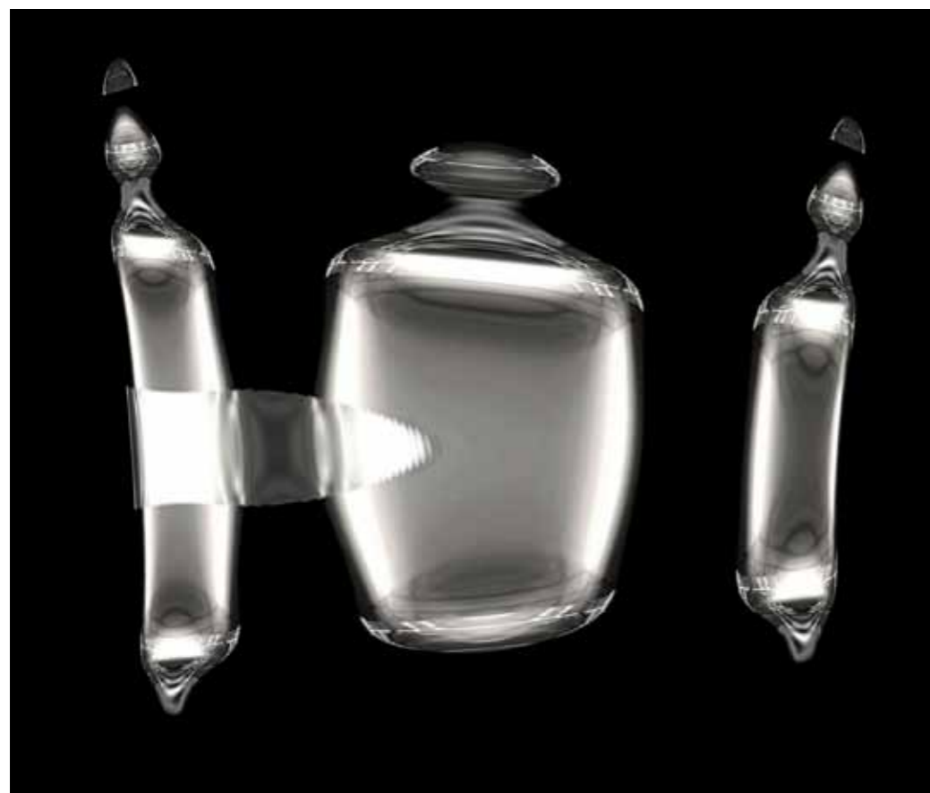
antónio canau "Translucent Sculptures", 2013 impressão digital/digital print 37 x 43,45cm